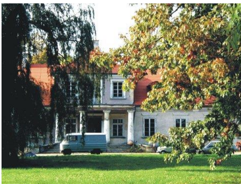
Rysunek nr 5. Zespół pałacowo-parkowy w Kamieniu.

Bliżej Kalisza leży wieś Kamień . W 1271 r. odbył się tu synod biskupów i zjazd książąt polskich, na którym uchwalono ustawy prowincjonalne i statuty. W latach 1655-1656 w lasach kamieńskich miały miejsce bitwy ze Szwedami. We wsi na uwagę zasługuje zespół pałacowo –parkowy w stylu klasycystycznym (rys. nr 5)