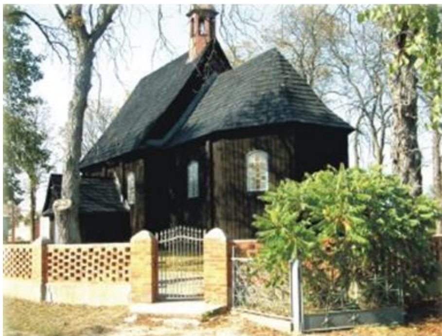
Rysunek nr 4. Drewniany kościół kryty gontem z XVII w. o barokowym wnętrzu z XV wiecznym krucyfiksem na belce tęczowej w Kosmowie; ;

Bliżej Kalisza leży wieś Kamień . W 1271 r. odbył się tu synod biskupów i zjazd książąt polskich, na którym uchwalono ustawy prowincjonalne i statuty. W latach 1655-1656 w lasach kamieńskich miały miejsce bitwy ze Szwedami. We wsi na uwagę zasługuje zespół pałacowo –parkowy w stylu klasycystycznym (rys. nr 5)