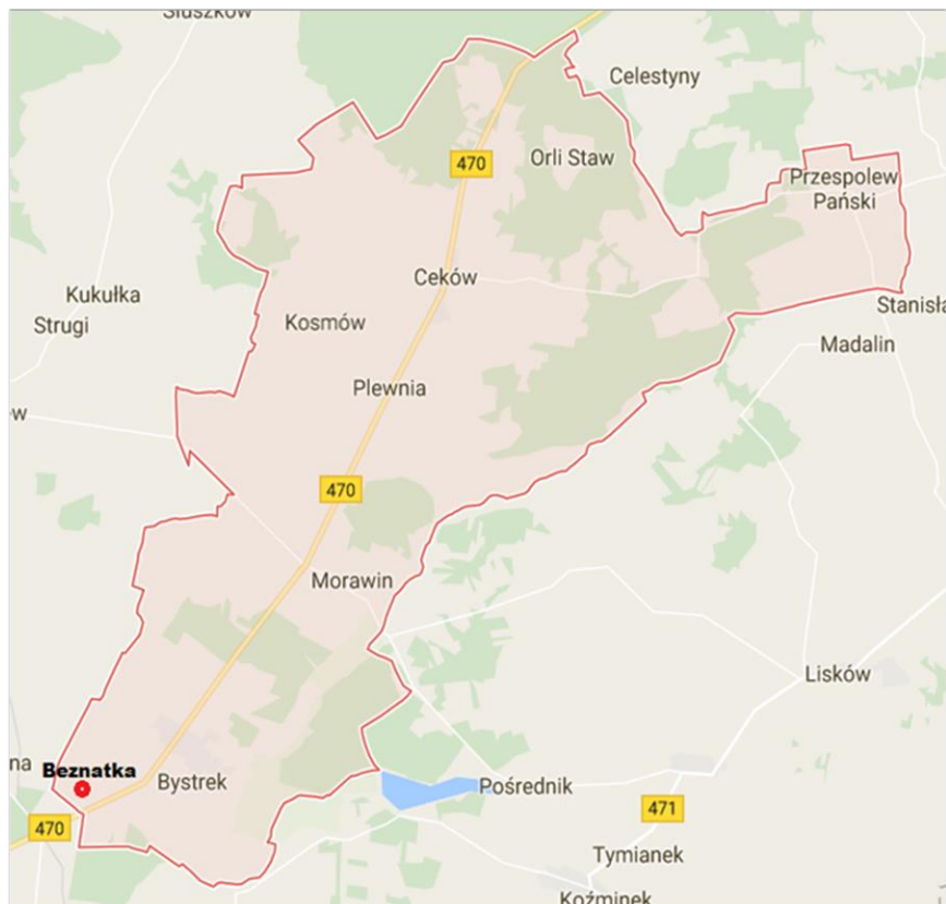
Rysunek nr 7. Położenie miejscowości Beznatka