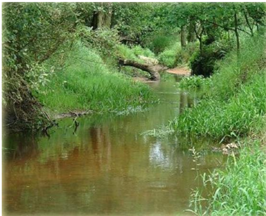
Rysunek nr 3. Dolina rzeki Swędrni

Od 1991 r. "Dolina rzeki Swędrni" (rys. 3) objęta została ochroną prawną, należy do strefy chronionego krajobrazu. Duża lesistość, różnorodne zbiorowiska roślin, torfowiska, bagna z ciekawą florą i fauną podnoszą walory krajobrazowe stwarzając warunki do pieszych, rowerowych wędrówek oraz do uprawiania biegów. Na terenie gminy znajduje się 1063 ha obszarów chronionego krajobrazu.