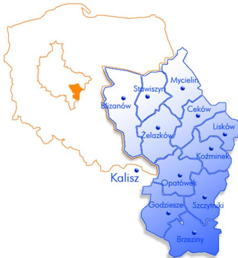
Rysunek 1. Położenie Gminy Ceków-Kolonia

Gmina Ceków-Kolonia położona jest w południowo-wschodniej części województwa wielkopolskiego, w dolinie rzeki Swędrni i Żabianki.