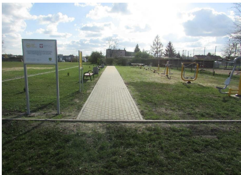
Rysunek nr 7 Siłownia zewnętrzna

Miejscowość Ceków-Kolonia jest w 85 % skanalizowana. Większość mieszkańców posiada dostęp do sieci wodociągowej -99 %, która zasilana jest z istniejącej stacji uzdatniania wody wybudowanej w 2017r. Wydajność stacji wynosi 62 m 3 /h i korzysta ona z dwóch ujęć głębinowych o wydajności 22 i 40 m 3 /h.