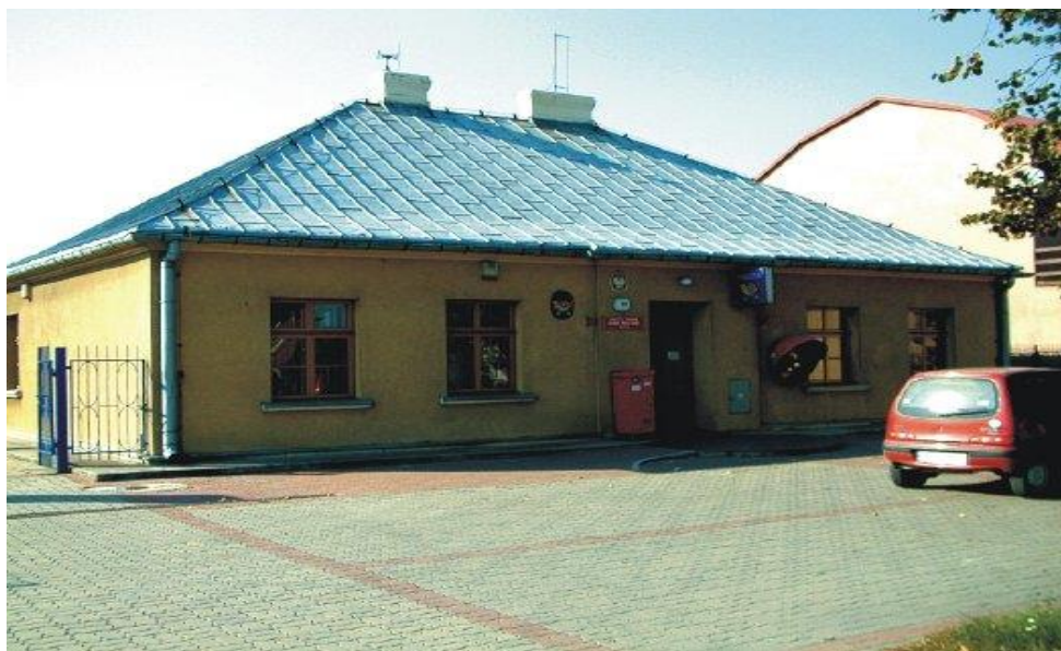
Rysunek nr 6 Budynek poczty

W samym Cekowie zachował się tylko jeden zabytkowy budynek poczty wozowo-konnej z czasów Królestwa Polskiego . Ceków stał przy głównym trakcie nr 85 prowadzącym z Warszawy do Kalisza i dalej do Wrocławia. Lipska, Drezna i Paryża . W cekowskiej stacji odbywały się ekspedycje i przepręgi konne.