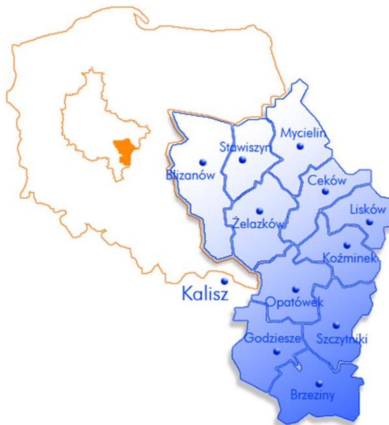
Rysunek 1. Położenie Gminy Ceków-Kolonia

Gmina Ceków-Kolonia położona jest w południowo-wschodniej części województwa wielkopolskiego, w dolinie rzeki Swędrni i Żabianki.