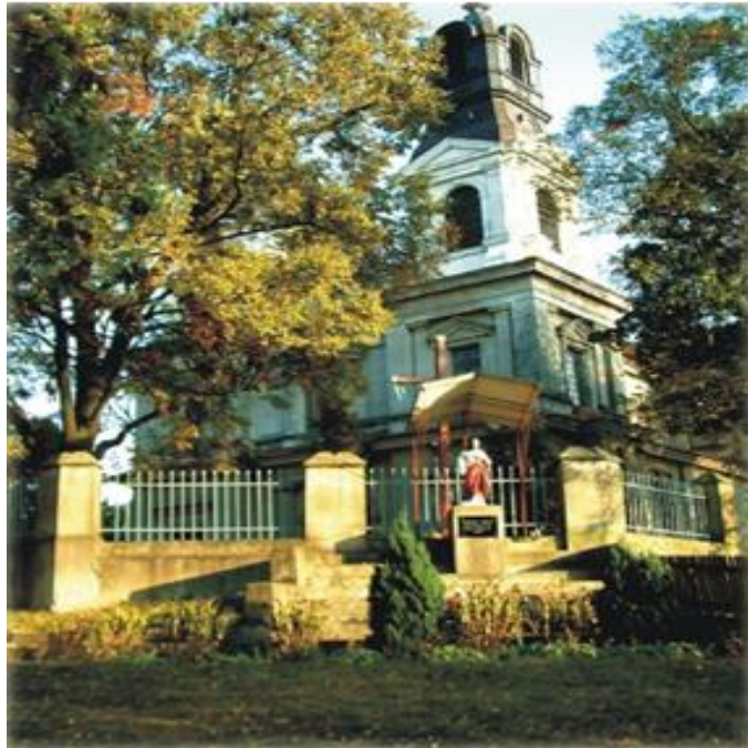
Rysunek nr 5. Dwuwieżowy kościół parafialny w Przespolewie

W Przespolewie Kościelnym znajduje się okazały dwu wieżowy kościół (rys. nr 6), a w miejscowości Prażuchy Stare ewangelicki zespół kościelny zaprojektowany przez Franciszka Reinstaina .