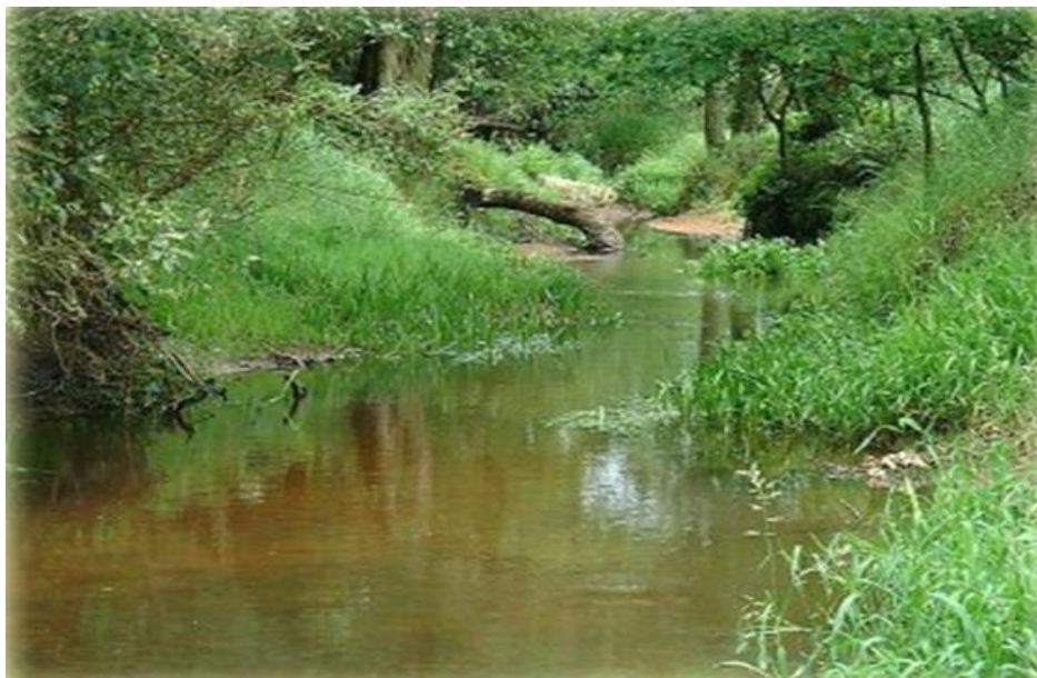
Rysunek nr 3. Dolina rzeki Swędrni