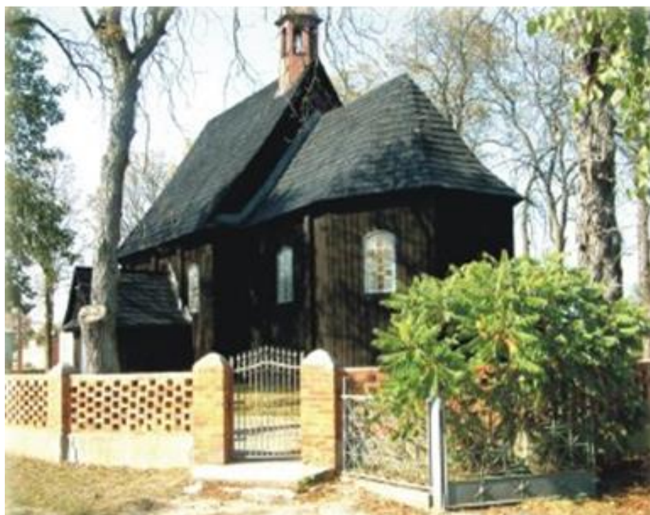
Rysunek nr 4. Drewniany kościół kryty gontem z XVII w. o barokowym wnętrzu z XV wiecznym krucyfiksem na belce tęczowej w Kosmowie; ;

Na terenie gminy leży wieś Kosmów znana od 1410r. z drewnianym kościółkiem z 1691 r. (rys. nr 4). W okresie insurekcji kościuszkowskiej miała tu miejsce potyczka z Prusakami, tu też urodził się poeta okresu romantyzmu Stefan Garczyński zaprzyjaźniony z Mickiewiczem.